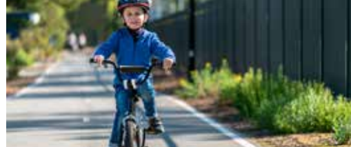
Weyts investeert in Herzeelse fietsinfrastructuur p. 3