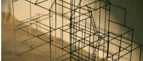
Herzele wint een Thuis voor een beeld p. 2