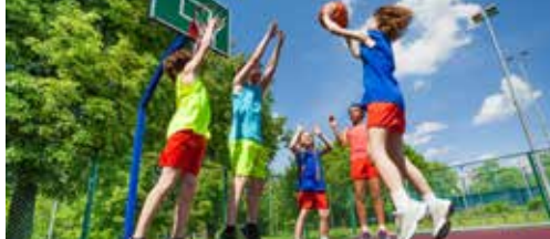
Samenwerking scholen en sportclubs p. 2