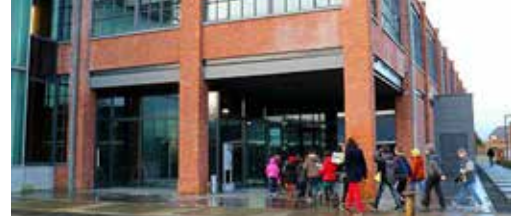
Bib versterkt sociaal weefsel p. 3