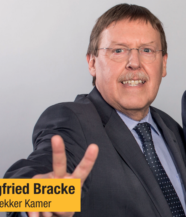
Siegfried Bracke Lijsttrekker Kamer