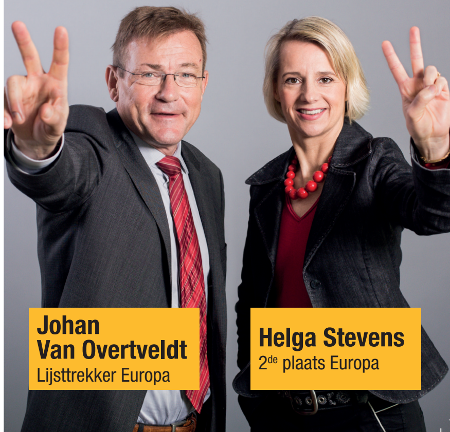
Johan Van Overtveldt Lijsttrekker Europa

De N-VA wil dat de verschillende landen van de EU hun identiteit kunnen bewaren. De EU moet niet over alles beslissen. Een Verenigde Staten van Europa, een Europese superstaat, is dus géén goed idee. De Unie moet groeien van onderuit en mag niet van bovenaf worden opgelegd.