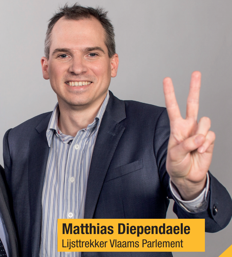
Matthias Diependaele Lijsttrekker Vlaams Parlement

Ik heb het te lang voor mijn ogen zien gebeuren: traditionele partijen doen alsof ze regeren, maar in werkelijkheid organiseren ze de stilstand. Gevolg? We gaan langzaam, bijna ongemerkt de berg af. Hoge werkloosheid, hoge belasting, hoge loonkost, hoge schuld. In ruil? Lage nettolonen, lage pensioenen, een sociale zekerheid die alsmaar minder zeker is.