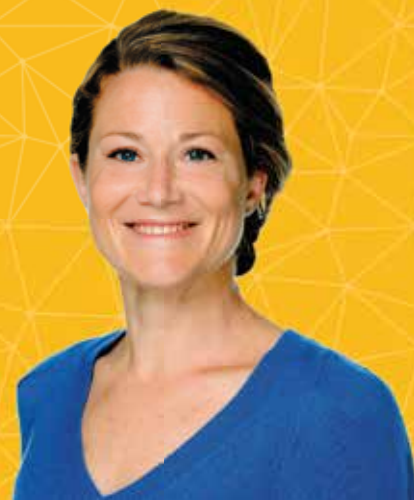
Anneleen Van Bossuyt Kamerlid

“De N-VA blijft kiezen voor een betaalbaar, betrouwbaar en duurzaam energiebeleid. Dat maakt ons onafhankelijk van schurkenregimes. ”