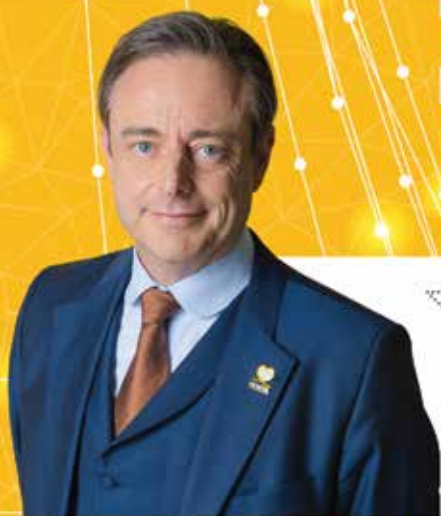
Bart De Wever Algemeen voorzitter

Engie passeert tweemaal langs de kassa. Door het uitstelgedrag van paars-groen kan het energiebedrijf extra veel geld vragen om de kerncentrales te verlengen. En daarbovenop ontvangt Engie van de regering ook nog eens gassubsidies. De belastingbetaler betaalt het gelag.