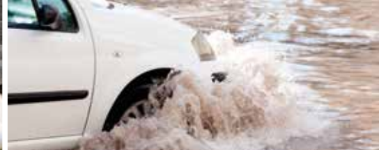
Oost-Vlaanderen (z)onder water (p.3)

Hillegem Ressegem Sint-Antelinks Sint-Lievens-Esse