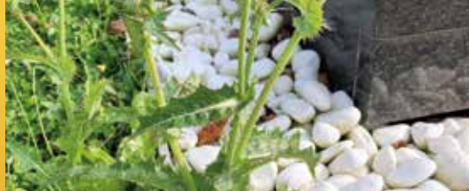
Onderhoud en toezicht op begraafplaatsen (p.2)